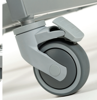
Solidne koła z blokadami