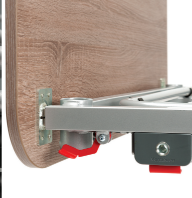
Łatwy demontaż paneli bocznych i poręczy