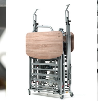
Zestaw transportowy na kółkach zapewnia także łatwe przechowywanie